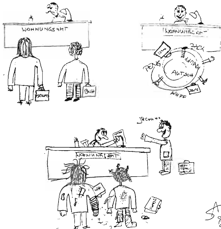
Wohnungssüchtige SozialarbeiterInnen – oder: wenn zwei sich streiten, dann...

Der Text wurde zum großen Teil aus dem Konzeptpapier des Landes direkt zitiert, für Auslassungen und Aktualisierungen ist Christof Gstrein verantwortlich.